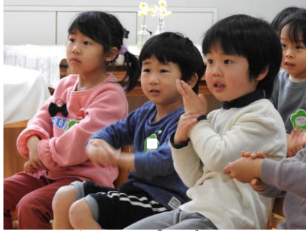
つかまえたのポーズ