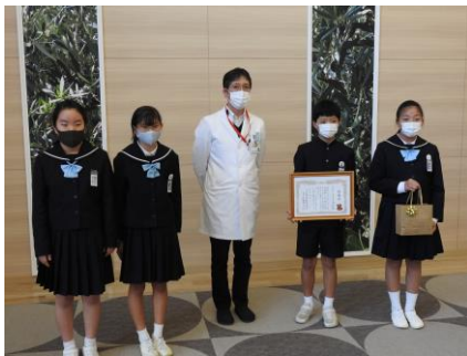
土庄小学校よりご寄附を戴きました