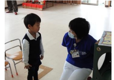
なぜ、手を洗わないとばい菌は取れないの？