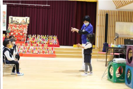
手洗いきちんとできるかな？