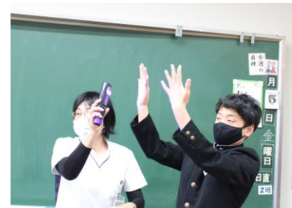
ブラックライトで手洗いチェック！