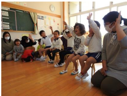
クイズに元気に答えます