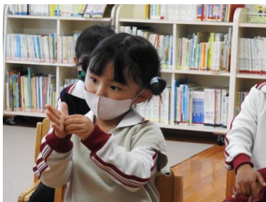
オオカミのポーズ