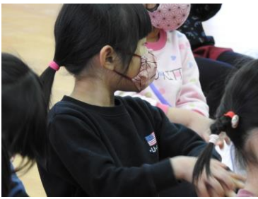
かめさんのポーズ