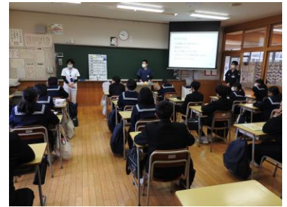
真剣に聴いています