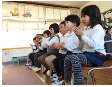
みんな一生懸命練習しました